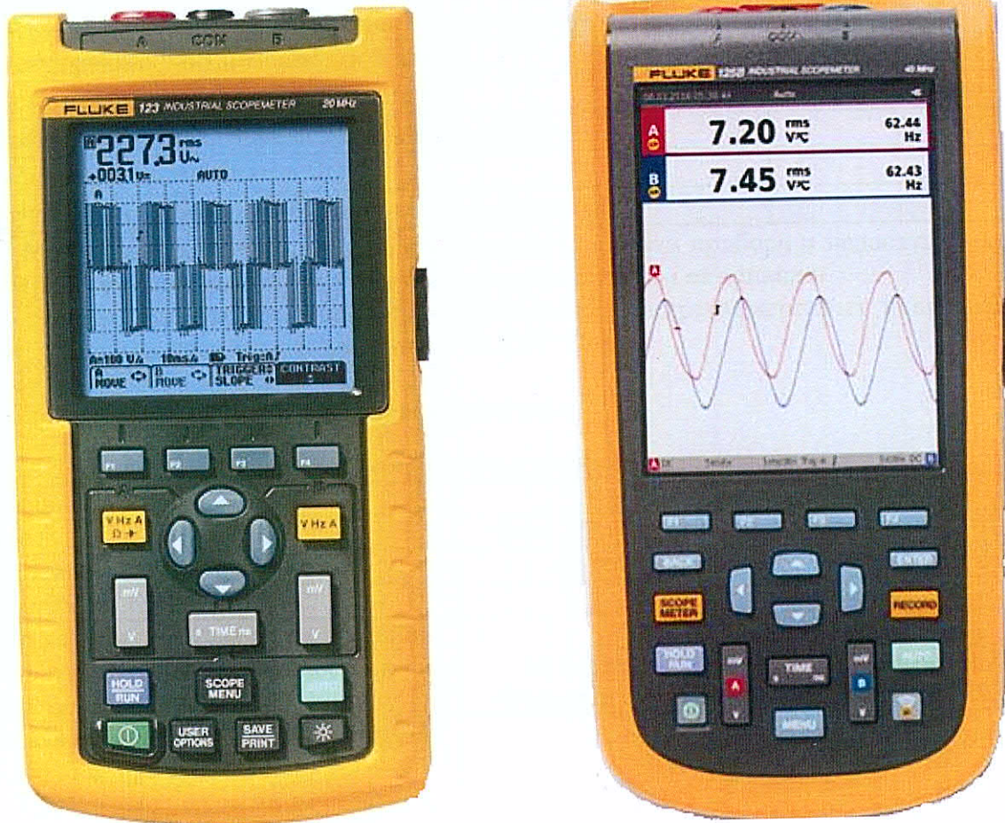
Модели 123, 124 и 125 Модели 123В, 124В и 125В