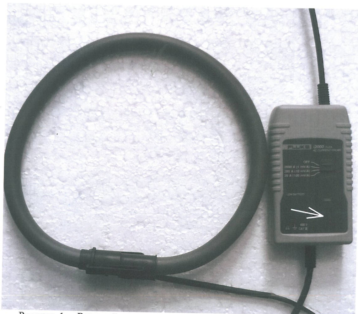
Рисунок 1 - Внешний вид поясов модели Fluke i2000 Flex, стрелкой показано место нанесения знака утверждения типа.

Пояса, внешний вид которых показан на рисунках 1-3, представляют собой портативные электроизмерительные приборы. Принцип действия поясов при измерении силы тока основан на преобразовании магнитного потока, создаваемого измеряемым током, в электрическое напряжение. Для измерения токонесящий провод охватывается ферромагнитным сердечником, в котором создается магнитное поле, пропорциональное измеряемому току.