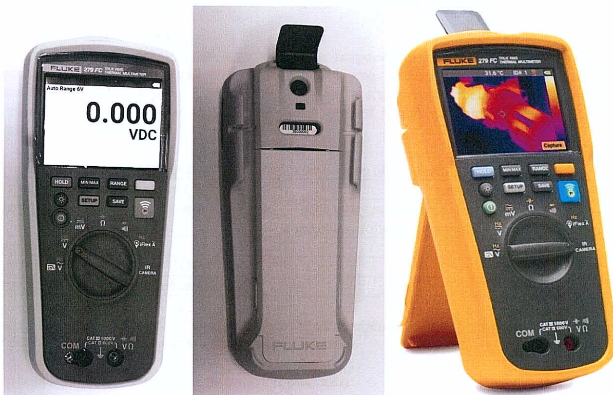
Рисунок 1 - Внешний вид мультиметра

Мультиметры, внешний вид которых показан на рисунке 1, представляют собой многофункциональный цифровой портативный электроизмерительный прибор. На передней панели мультиметров расположен жидкокристаллический дисплей, переключатель режимов измерений и другие кнопки управления прибором, а также разъемы для подключения измерительных проводов. Измерения силы переменного тока осуществляются с помощью индукционного датчика iFlex i2500. Непосредственная комплектация такими датчиками является отдельной опцией, но подключить указанный датчик можно к любому экземпляру мультиметра.