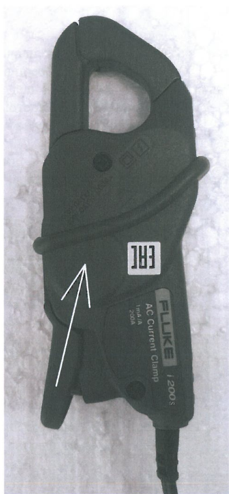
Рисунок 1 - Внешний вид клещей модели Fluke i200 и Fluke i200s, стрелкой показано место нанесения знака утверждения типа.